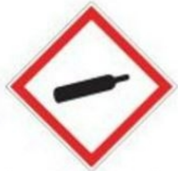
Paineen alaiset kaasut